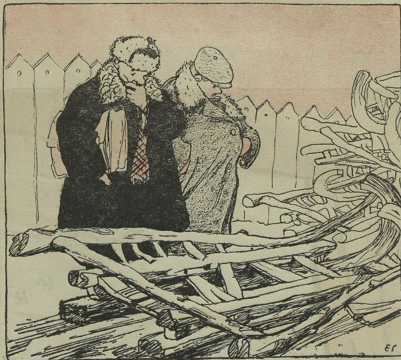
Мал. Е. Ганкіна.

— Добра было Астроўскаму пісаць: «Не ў свае сані не сядай!»