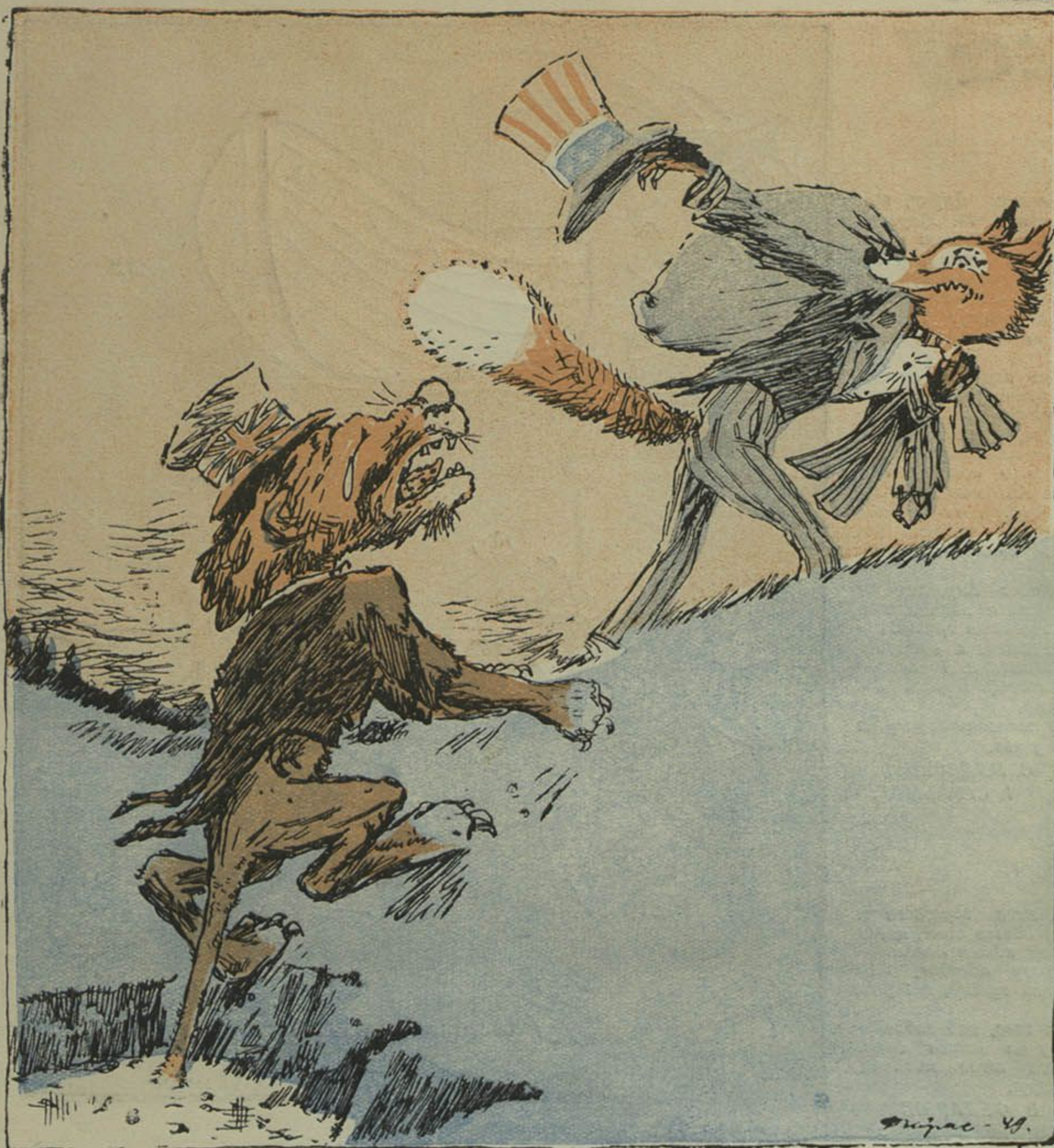
Палез па рыбку, а злавіўся сам.