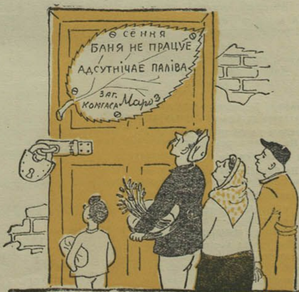
— Бачыш, як прыляпіўся! І ліха яго ведае, чым гэты банны ліст змыць.