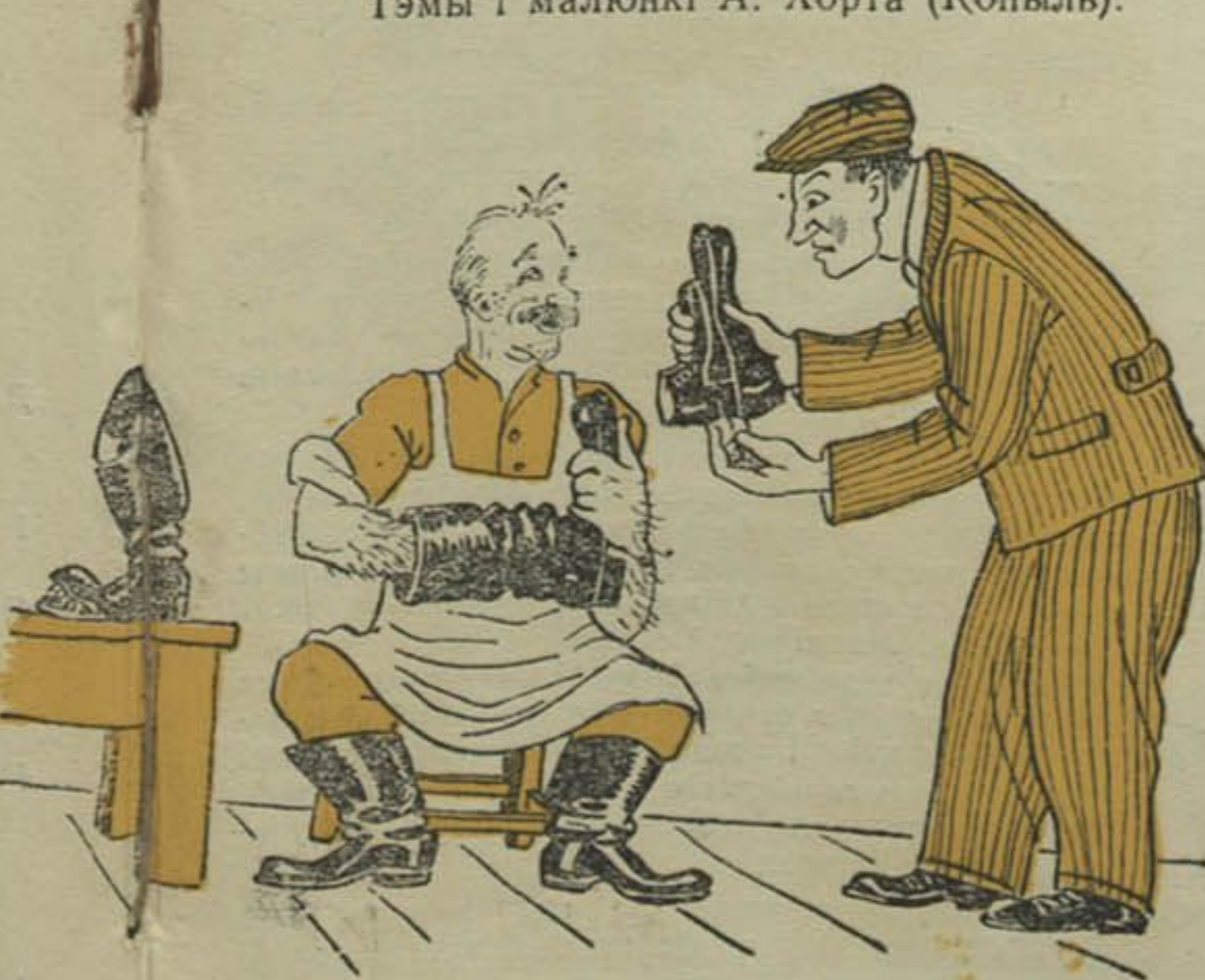
Заказчык: — Што гэта вы мне пашылі? Майстар (з арцелі «Праўда»): — А вы-ж і заказвалі чаравікі-недамеркі.