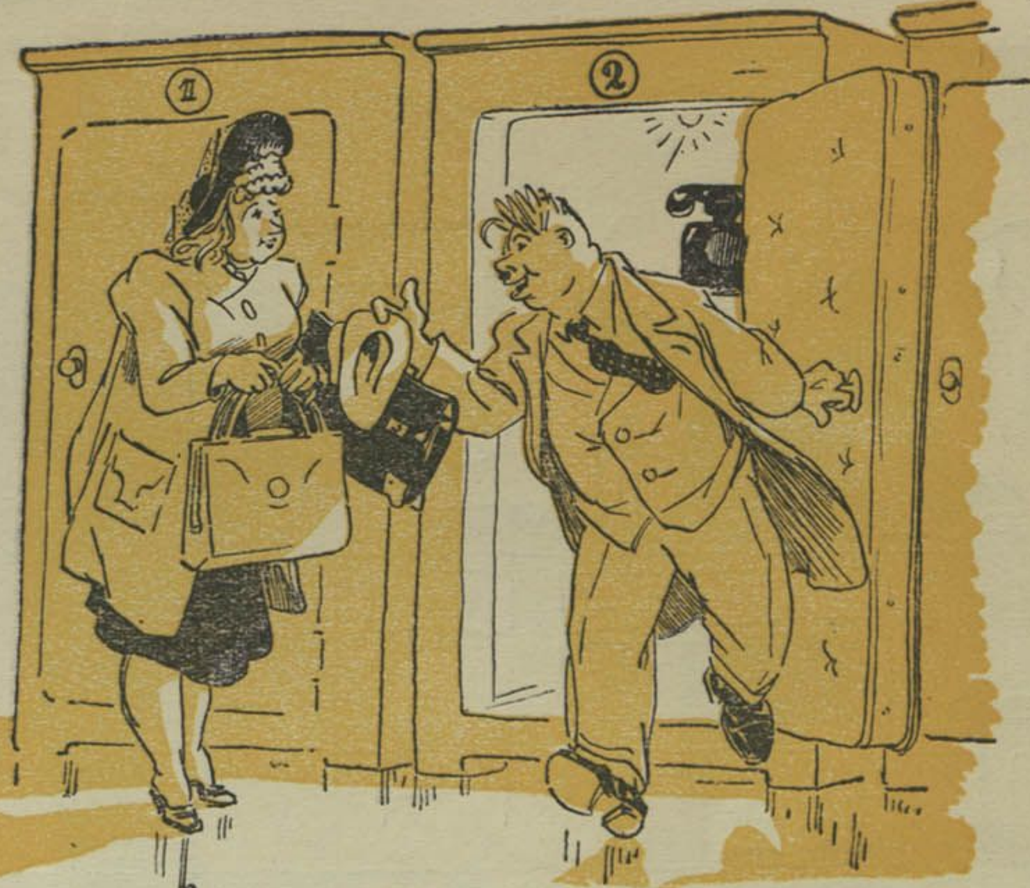
— Ты заўсёды гаворыш, што мае словы нічога не варты. А тут ацанілі! На цэлых 40 рублёў нагаварыў.