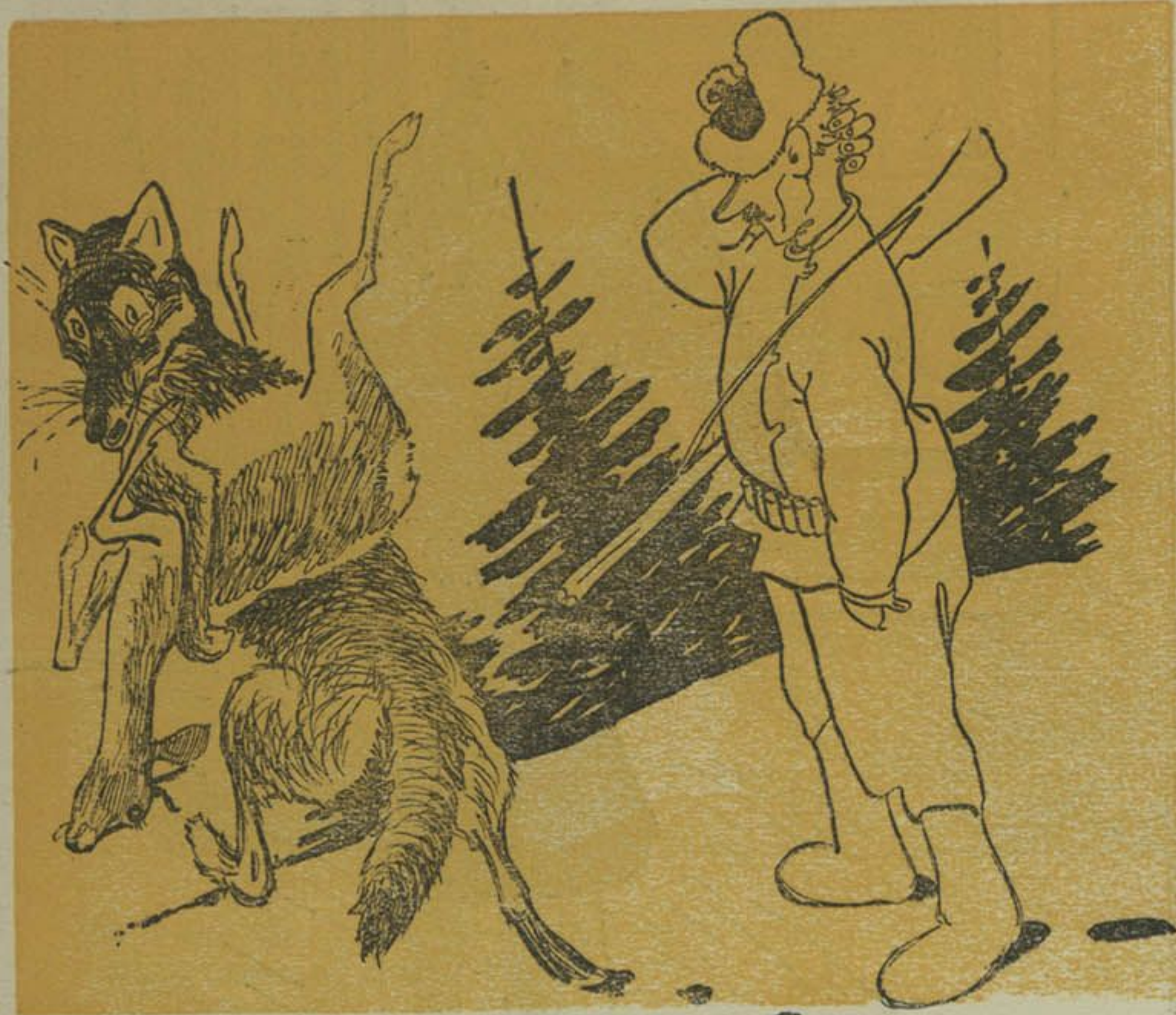
Палаўнічы: — Эх, шкада, воўк яго рэж! Пацягнуў казу, а я за ёю цэлы дзень ганяюся.