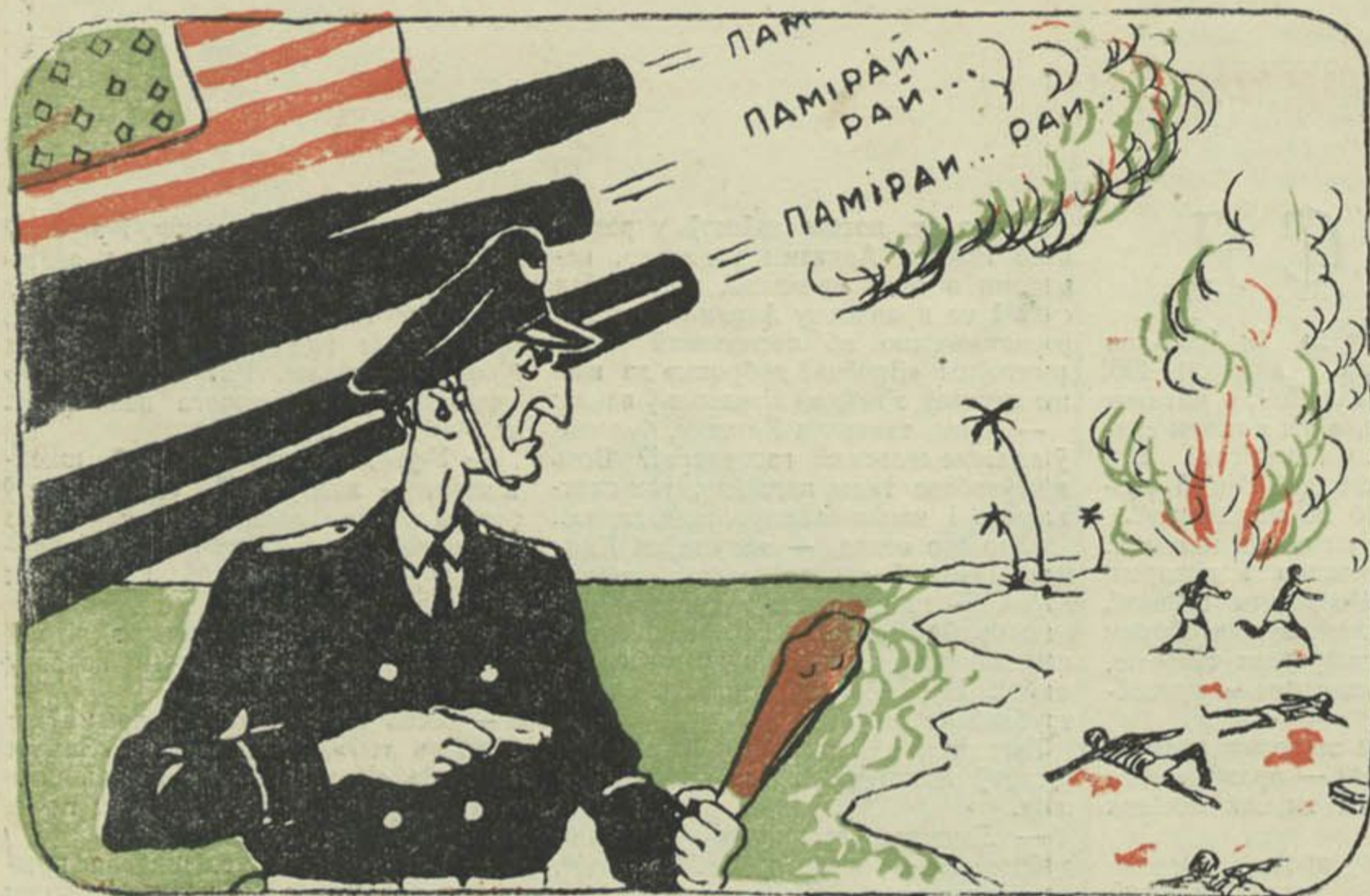
... на ударних інструментах.