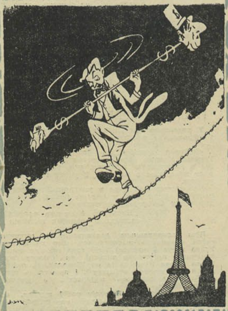
Эквілібрыстыка французскага прэм'ер-міністра Бідо. (Малюнак з румынскай газеты «Скынтэя».)

(Малюнак з англійскай газеты «Дейлі уоркер».)