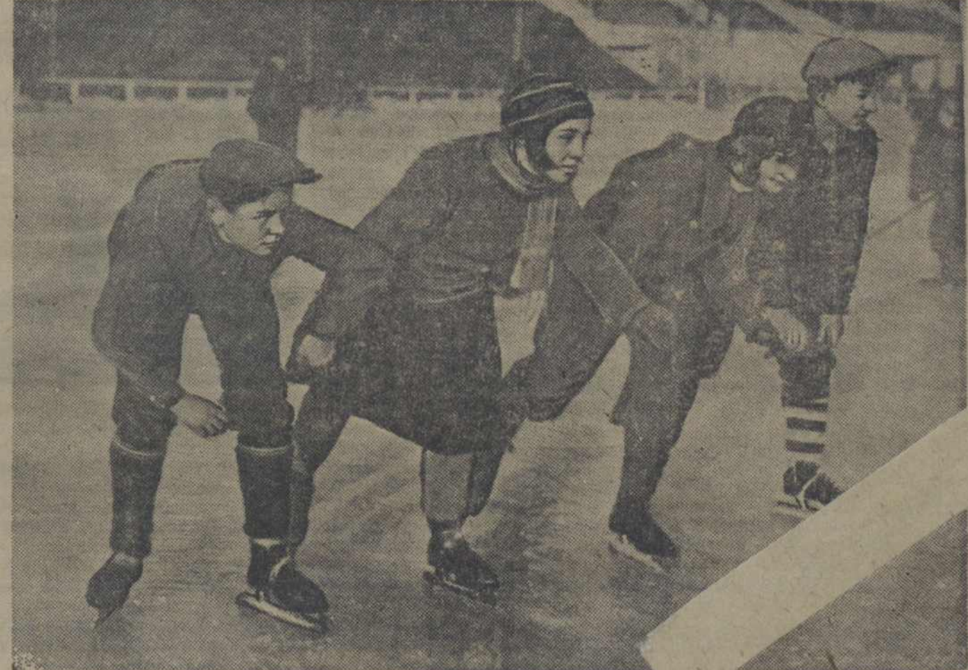
Вучні 13 і 24-й менскіх школ на катку «Дынамо».