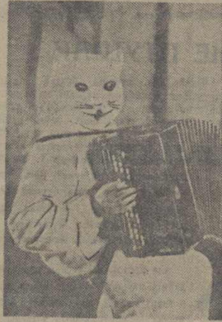
«Кот» — баяніст на ёлцы.

— Работа гурткоў скончана — аб'я- лне радыё.