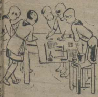
на выпускам нацённай газеты