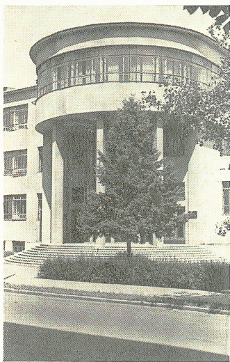
Галоўны ўваход у Дзяржаўную бібліятэку БССР.

Творчая біяграфія таленавітага архітэктара складаная: у 1928—1934 гг. ён актыўна працуе ў Беларусі, стварае шэраг праектаў, паспяхова ўдзельнічае ў архітэктурных конкурсах, але многія з яго лепшых праектаў не былі ажыццёўлены, іншыя значна перароблены. З задум Г. Лаўрова найбольш поўна здзейснены, хоць і не да канца, праект будынка Дзяржбібліятэкі (1929—1930) 1 . Створаны ў духу канструктывізму, ён адлюстроўвае характэрнае для многіх той эпохі таго часу імкненне да прастаты планаў, фасадаў, архітэктурных прыёмаў, форм і падкрэсленай лаканічнасці. У