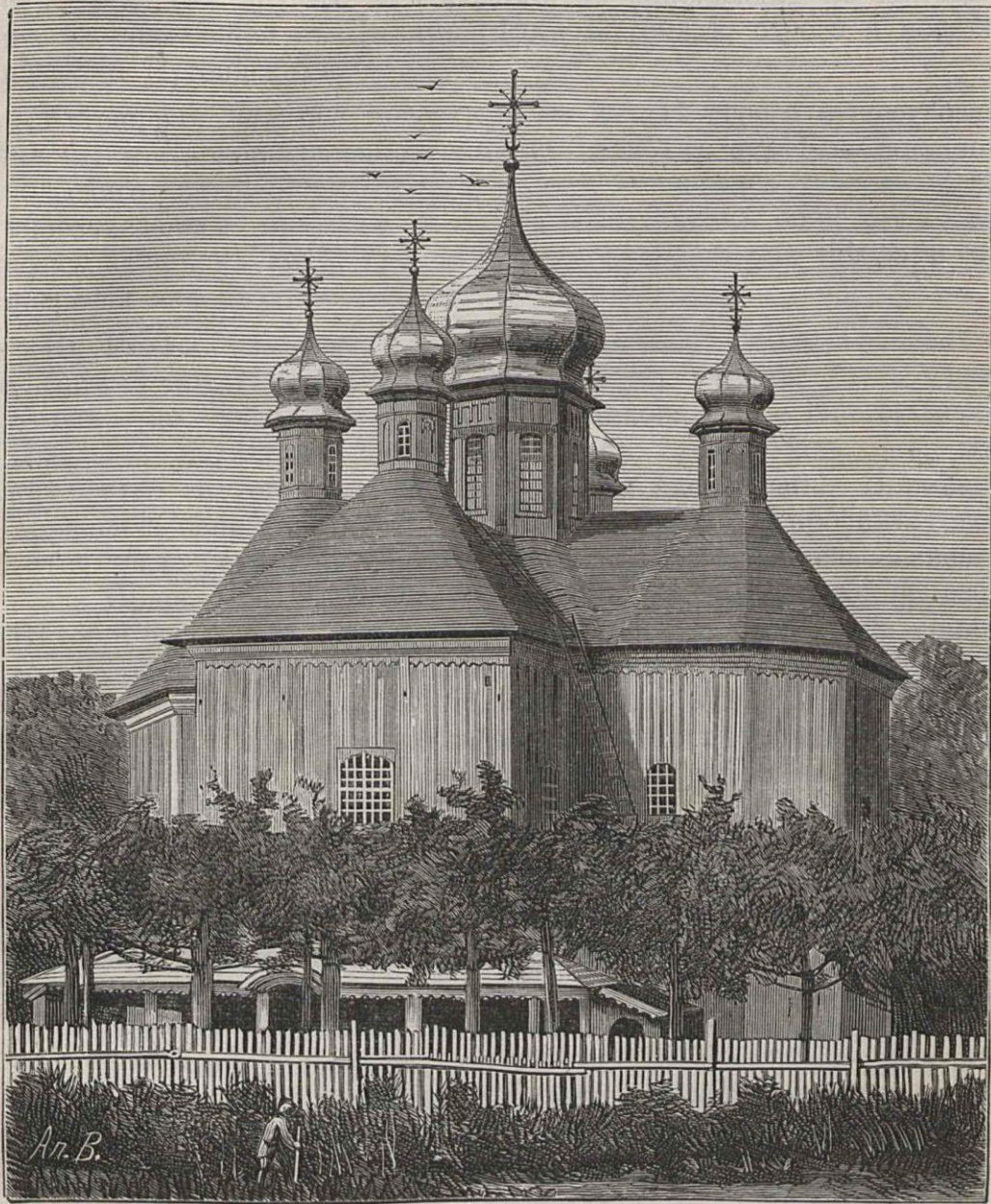
ДРЕВНЯЯ ЦЕРКОВЬ ОРШАНСКАГО КУТЕЙНСКАГО МОНАСТЫРЯ.