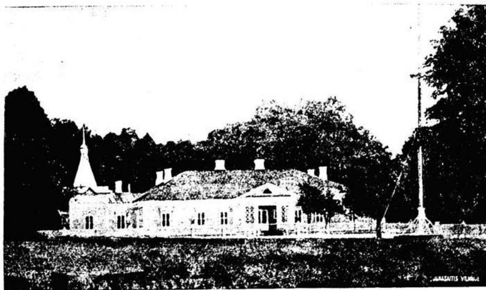
Старый Борисовъ, Дочь Наполеона съ фланцевъ стороны.

пополудни русское войско удостовѣрилось въ перевѣсъ непріятельской силы, и, послѣ нѣкотораго сопротивленія, отступило за рѣку Березину и, сжегши недавно выстроенный французами мостъ, расположилось на той самой горѣ, на которой три дня тому назадъ одержало совершенную побѣду надъ французами. Итакъ, городъ Борисовъ вторично впалъ въ руки непріятели, и въ тотъ же вечеръ вступилъ въ Борисовъ маршалъ Удино со своею командою, соединенною съ остатками польскаго войска, состоявшаго подъ начальствомъ генерала Домбровскаго. На другой день, т. е. 12-го ноября, вступилъ въ Борисовъ маршалъ Ней со своею дивизіею. 13-го числа утромъ прибыла въ Борисовъ гвардія Наполеона, и въ тотъ же день, въ 5-мъ часу пополудни, прибылъ самъ Наполеонъ. Онъ,