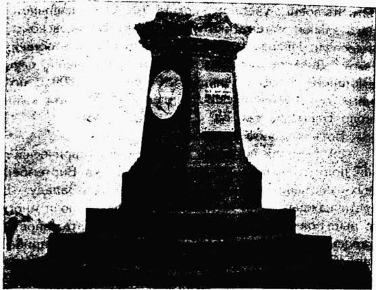
Памятникъ у дер. Студенки, въ 12 верст. отъ г. Борисова, на мѣстѣ переправы французскихъ войскъ въ 1812 г.

расположенныхъ по Московскому тракту. Однимъ изъ нихъ и былъ Борисовъ. На правомъ берегу Березины передъ мостомъ были насыпаны окопы (нынѣ т. н. „батареи“) для двадцати - тысячнаго русскаго войска. Всѣ эти работы были закончены къ веснѣ 1812 г. Маршалъ Даву занялъ въ концѣ іюня Борисовъ, а затѣмъ двинулся далѣе на востокъ. Въ Борисовѣ былъ устроенъ одинъ изъ крупныхъ продовольственныхъ пунктовъ для французской арміи и образована подѣ