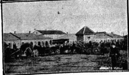
Г. Борисовъ. Виды улицъ: 1) Виленской, 2) Саутиной, 3) Московской, 4) Лепельской, 5) Базарной и 6) базарной площади у городской водоканки.