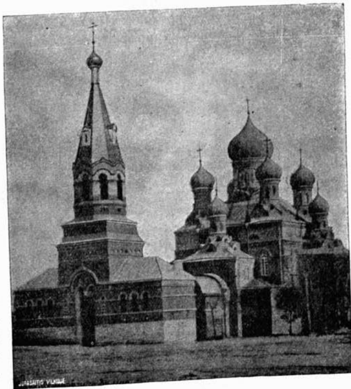
Г. Борисовъ. Православный соборъ во имя Воскресенія Христова съ приделами св. кн. Александра Невскаго и св. кн. Владимира.

Въ г. Борисовѣ два православныхъ храма, въ Новоборисовѣ—одинъ, одинъ костелъ р.-католическій и 10-ть еврейскихъ синагогъ. Главный православный храмъ—городской соборъ во имя Воскресенія—каменный, находится на базарной площади. Онъ 3-хъ-престольный, построенъ въ 1870 г., византийской архитектуры. о 7-ми главахъ, по размѣрамъ не великъ, такъ что въ большіе праздники