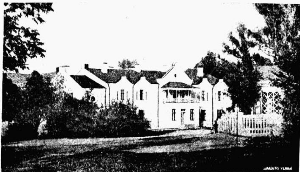
Старый Борисовъ. Дворецъ великихъ князей Николая и Петра Николаевичей.

Старый Борисовъ ничто иное, какъ экономія имѣнія великихъ князей Николая и Петра Николаевичей, въ пяти верстахъ къ сѣверо-западу отъ г. Борисова, вверхъ по теченію рѣки Березины. Въ Старый Борисовъ ведетъ изъ города шоссе и устроенъ телефонъ. Кромѣ дворца и службъ въ Старомъ Борисовѣ на-