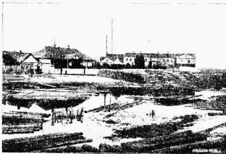
Главные корпуса спичечной фабрики братьевъ Содомотовыхъ „Викторія“.

Съ противоположнымъ берегомъ р. Березины городъ соединенъ отъ Минской улицы длиннымъ (около одной версты) деревяннымъ мостомъ, который устроенъ на сваяхъ и проходитъ надъ обводнымъ рукавомъ изъ рѣки Березины къ спичечной фабрикѣ „Викторія“.