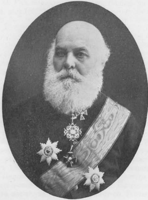
Яковъ Теодоровичъ Головацкій.