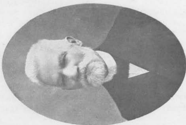
Иванъ Яковлевичъ Спрогисъ.