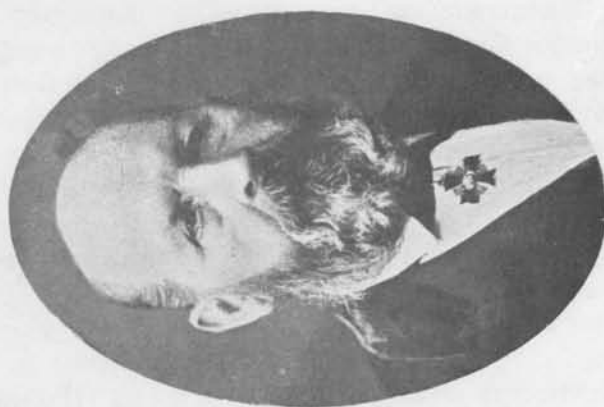
Никита Ивановичъ Горбачевскій.