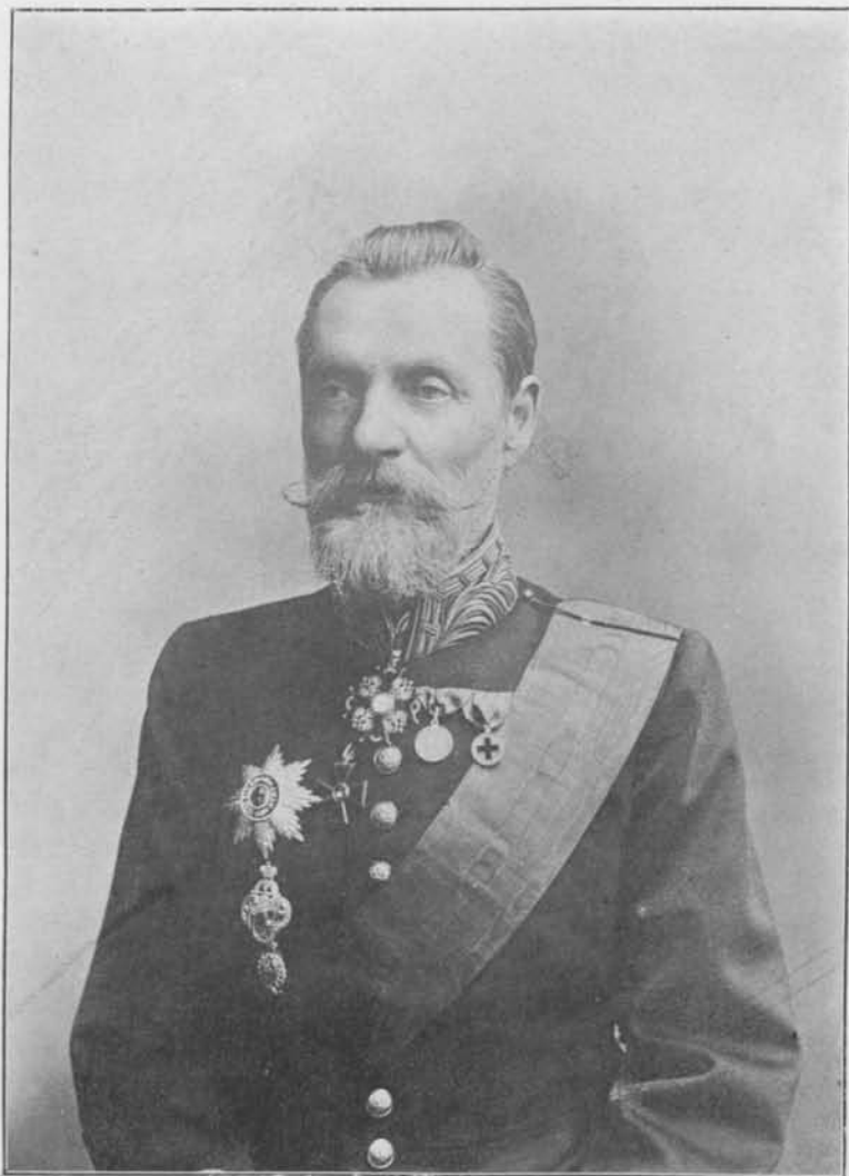
Алексѣй Андреевичъ Остроумовъ.

Попечитель Виленскаго Учебнаго Округа въ день празднованія 50-лѣтія Комис- сіи по изданію актовъ въ г. Вильнѣ, въ 1914 г.