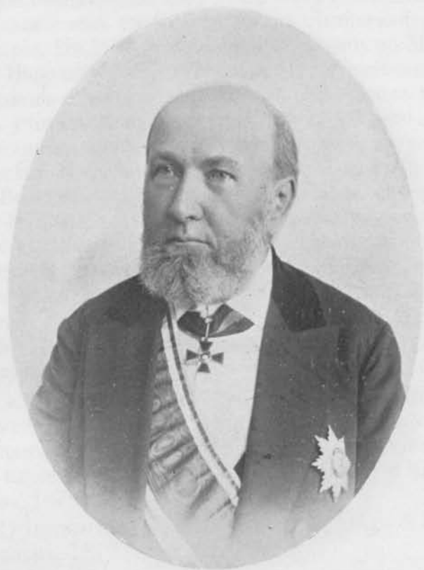
Юліанъ Омичъ Крачковскій.